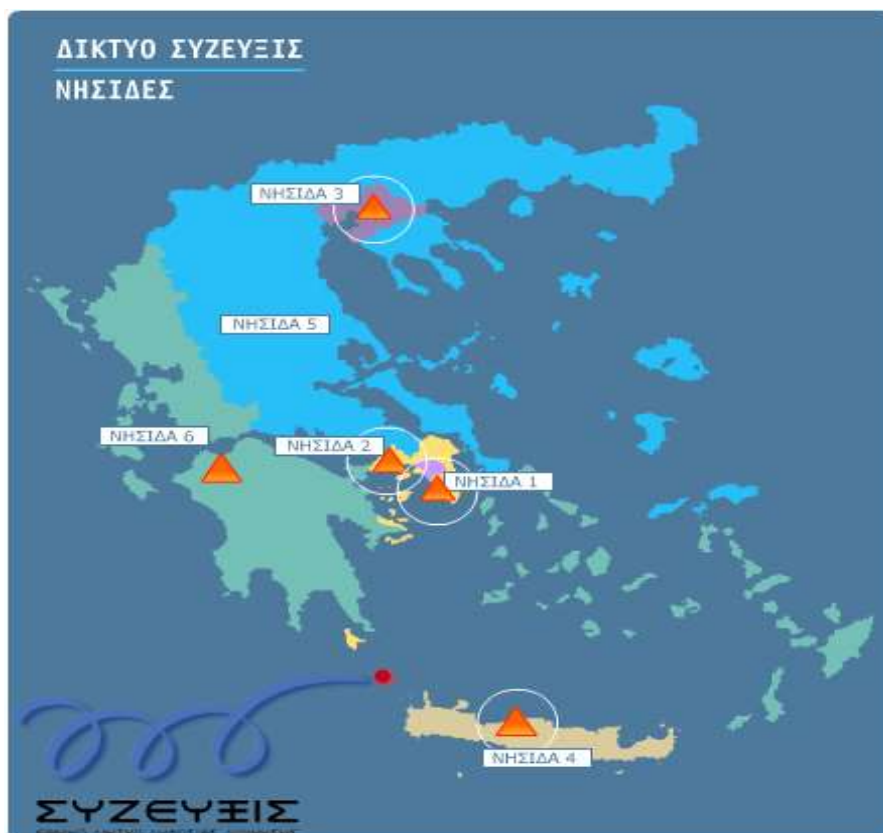
Σχήμα 1: Νησίδες ΣΥΖΕΥΞΙΣ

Ουσιαστικά, το δίκτυο ΣΥΖΕΥΞΙΣ εξασφάλισε για πρώτη φορά για τους φορείς που συμμετείχαν σε αυτό σύγχρονες τηλεπικοινωνιακές υποδομές, ευρυζωνική πρόσβαση πολύ υψηλών συμμετρικών